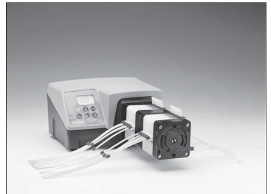
323Du/MC8 + 318MCX