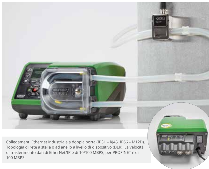
Collegamenti Ethernet industriale a doppia porta (IP31 – RJ45, IP66 – M12D). Topologia di rete a stella o ad anello a livello di dispositivo (DLR). La velocità di trasferimento dati di EtherNet/IP è di 10/100 MBPS, per PROFINET è di 100 MBPS