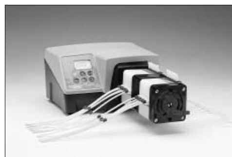
323S/MC8 + 318MCX